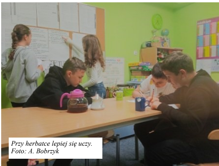
Przy herbatce lepiej się uczy.

Głównie jednak zajmowaliśmy się ortografią – również w nieszablony sposób. Organizowaliśmy happeningi uliczne: podchodziliśmy do przechodniów i zadawaliśmy pyta-